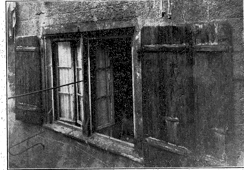
Fenêtre de la maison Gaudot, donnant à l'est sur les jardins et qui fut assaillie de pierres comme celles donnant sur la rue, lors des événements de 1768.

Pour mettre en branle cette voiture, il faut de sept heures du matin à six heures et demie du soir! Proposition du maire faite au château,